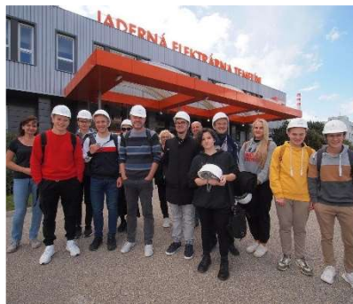
doprava na exkurzi Temelín