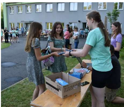
Akce "Bavme se spolu"