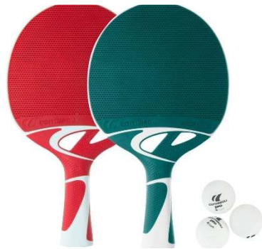
vybavení do TV