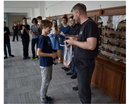
ceny do soutěží