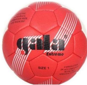
vybavení pro TV