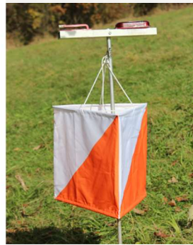
stojany s lampiony