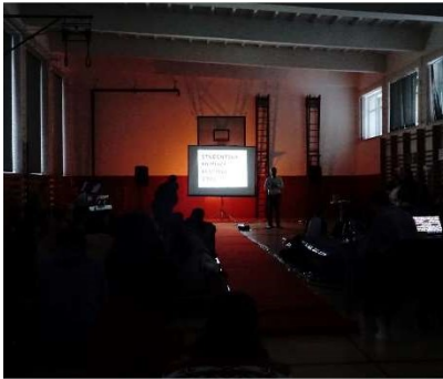
Studentský filmový festival