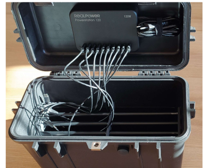
nabíjecí box pro tablety