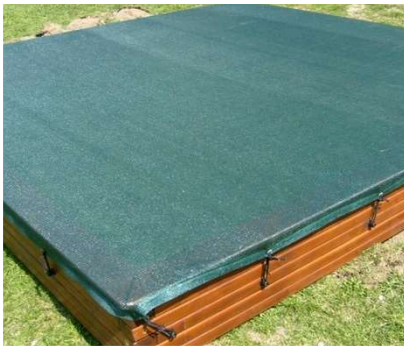
sít na pískoviště