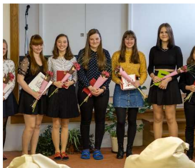
ceny do soutěží