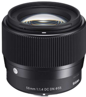
vybavení pro Multimediální kroužek

Nadační fond Biskupského gymnázia v Ostravě