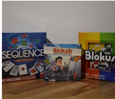
ceny do soutěží