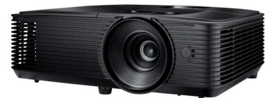
projektor a plátno